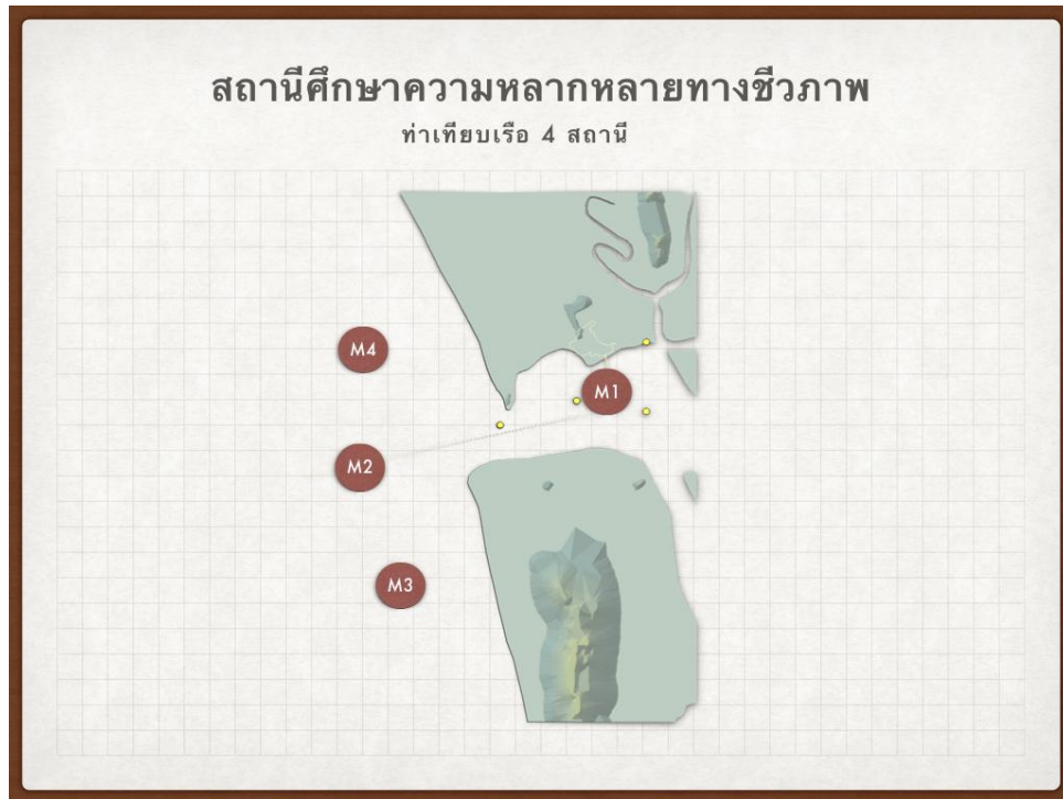
รูปที่ ข-1 สถานีเก็บตัวอย่างแพลงก์ตอนพืช แพลงก์ตอนสัตว์ ลูกปลาวัยอ่อน และสัตว์ทะเลหน้าดิน

2.1.2 แพลงก์ตอนสัตว์ (Zooplankton) เก็บตัวอย่างแพลงก์ตอนสัตว์โดยวิธีลากถุงกรอง แพลงก์ตอนสัตว์ขนาดช่องตา 330 ไมครอน ขนาดเส้นผ่านศูนย์กลาง 30 เซนติเมตร ขนาดความยาวถุง 90 เซนติเมตร ด้านหน้าของปากถุงกรองติดมาตรวัดน้ำ (Flow meter) ไว้ที่จุดกึ่งกลางของปากถุงเพื่อวัด ปริมาตรน้ำที่ไหลผ่านถุงกรอง อ่านค่าเริ่มต้นของมาตรวัดน้ำพร้อมจดบันทึกค่า ลากถุงกรองแพลงก์ตอนสัตว์ ในแนวเฉียง (Oblique tow) ที่ระดับผิวน้ำโดยใช้ความเร็วเรือประมาณ 2-3 นอต เป็นระยะเวลา 5 นาที เมื่อ ครบกำหนดเวลาให้อ่านค่ามาตรวัดน้ำสิ้นสุดพร้อมจดบันทึก จากนั้นรวบรวมน้ำตัวอย่างที่อยู่ในกะเปาะของ ถุงกรองแพลงก์ตอนใส่ขวดพลาสติกขนาด 500 มิลลิลิตร ต้องรักษาสภาพตัวอย่างแพลงก์ตอนสัตว์ทันทีด้วย ฟอร์มาลินให้ได้ความเข้มข้นสุดท้าย 10 เปอร์เซ็นต์