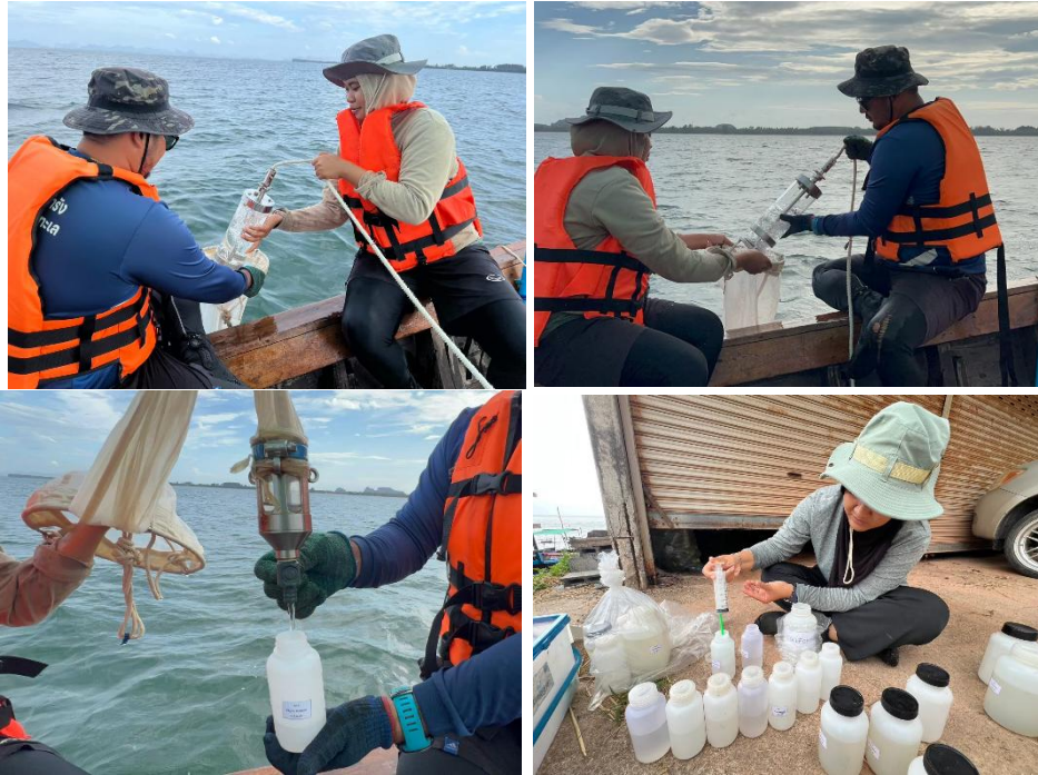
งานรวบรวมตัวอย่างแพลงก์ตอนพืช