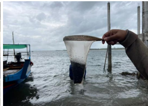
งานรวบรวมตัวอย่างสัตว์ทะเลหน้าดิน