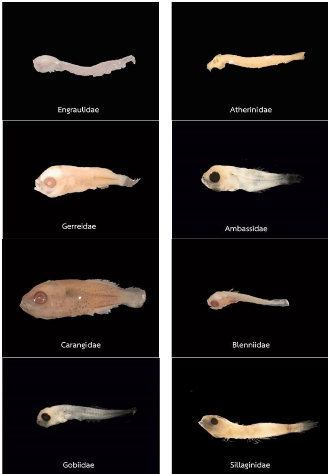
รูปที่ ซ-4 ภาพตัวอย่างลูกปลาวัยอ่อนที่พบในปี 2568