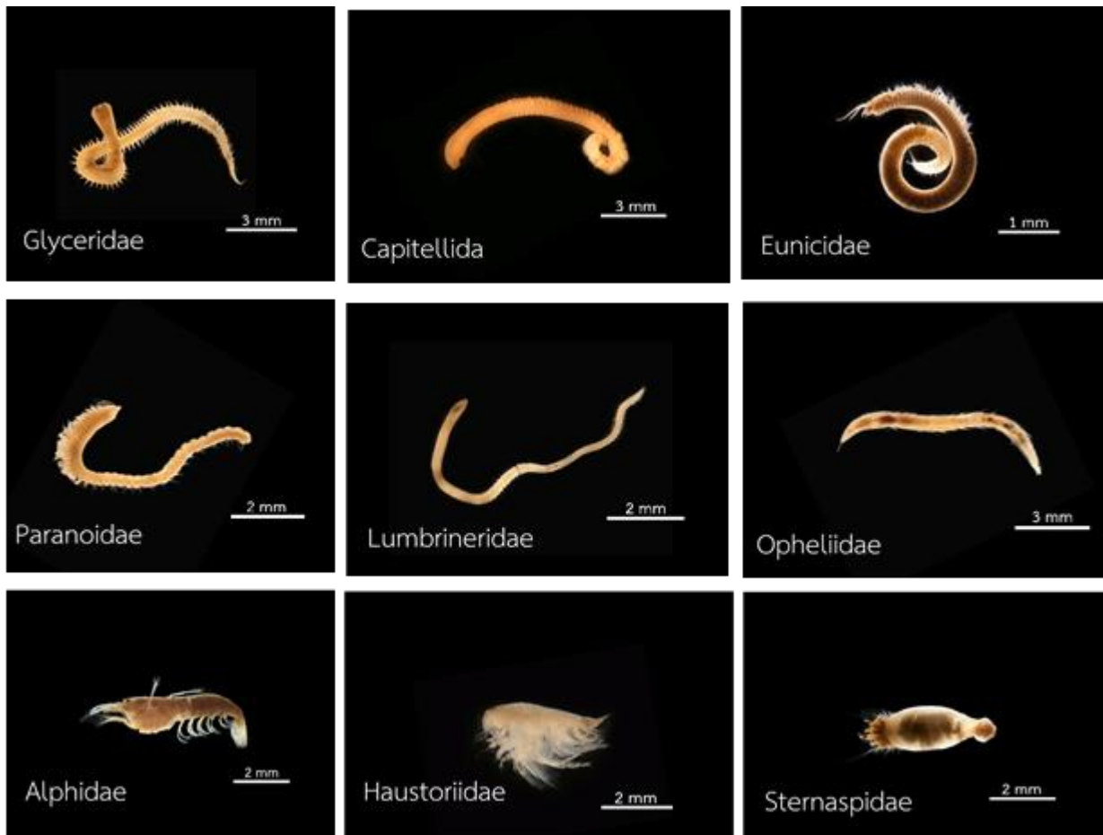
รูปที่ ซ-5 ภาพตัวอย่างสัตว์พื้นทะเลที่พบในปี 2568