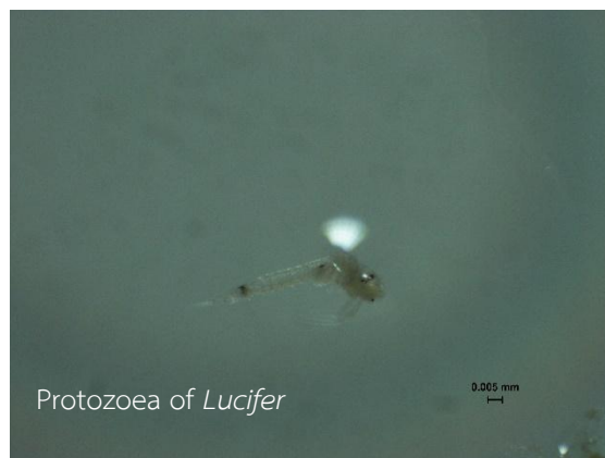
รูปที่ ซ-3 ภาพตัวอย่างแพลงก์ตอนสัตว์ที่พบในปี 2568