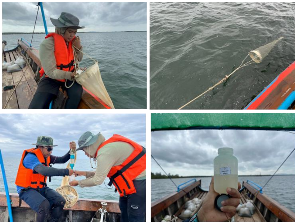
งานรวบรวมตัวอย่างแพลงก์ตอนสัตว์