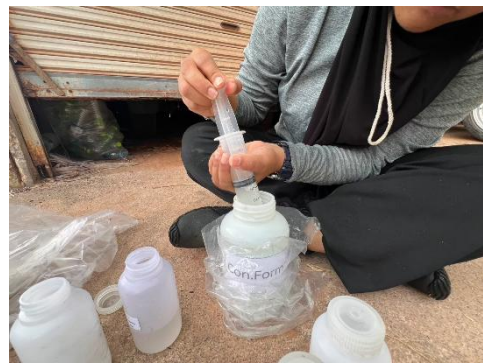
งานรวบรวมตัวอย่างลูกปลาว่ายอ่อน