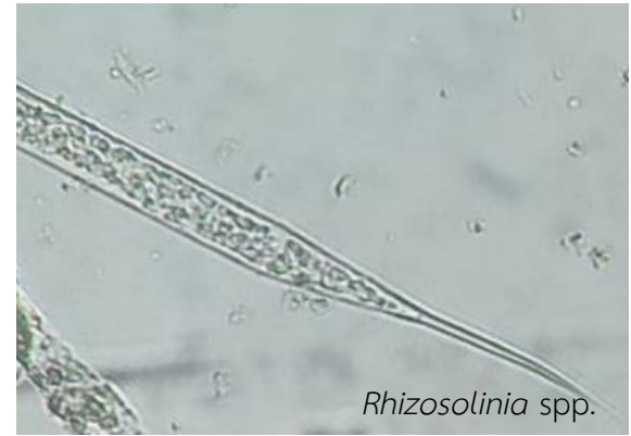
รูปที่ ซ-2 ภาพตัวอย่างแพลงก์ตอนพืชที่พบในปี 2568